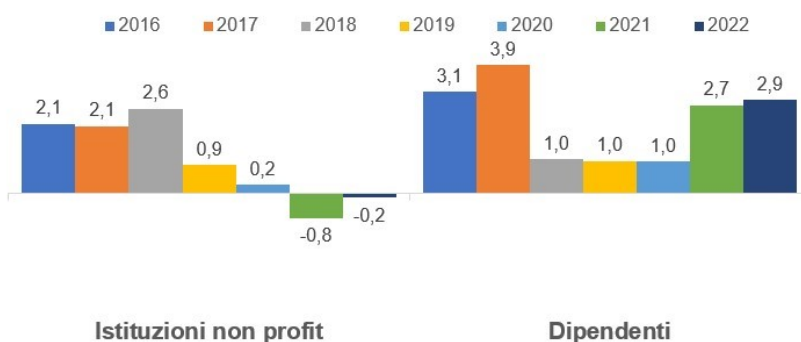
INP e dipendenti. Anni 2016-2022 (variazioni percentuali rispetto all'anno precedente)